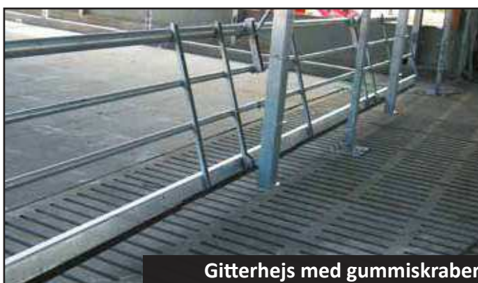
Gitterhejs med gummiskraber