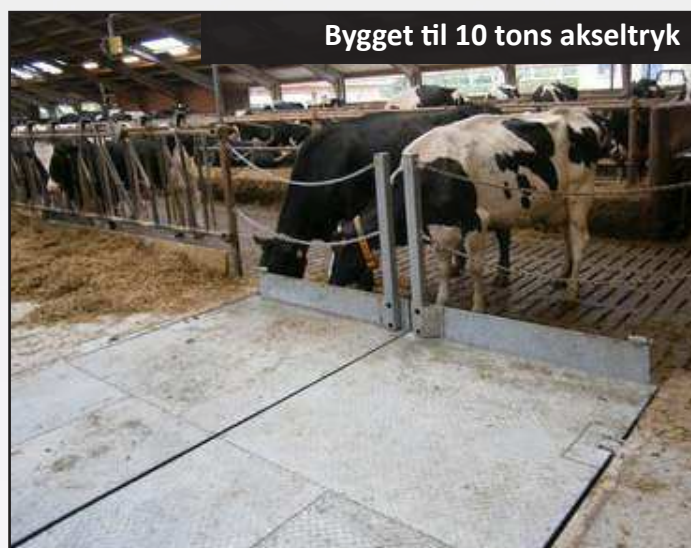
Bygget til 10 tons akseltryk